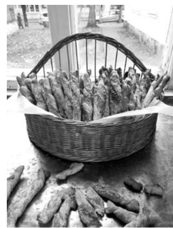
Į namus UAB „Jara Jums“ gali pristatyti maisto produktus.

Užsisakyti maisto produktų į namus gali ne tik Anykščių miesto gyventojai, bet ir gyvenantys rajono kaimuose. Tokiais atvejais prekių