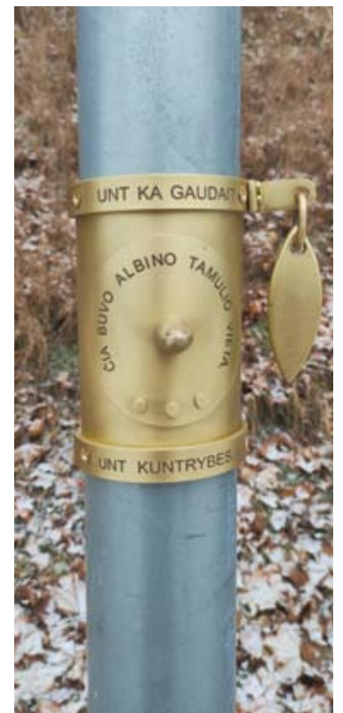
Atminimo ženklas dešiniajame Šventosios upės take atsirado sekmadienį.