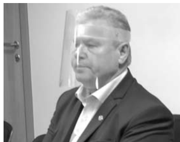
Kęstučio Tubio teisinis procesas vyksta jau beveik dvejus metus.

Vidmantas ŠMIGELSKAS vidmantas.s@anyksta.lt